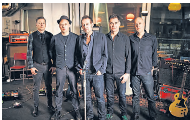
Züri West treten am 7. Juli in Murten auf.

Stars of Sounds 7. und 8. Juli 2017 www.starsofsounds.ch