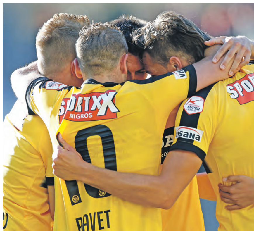
Obi ist zurück auf der Brust des BSC YB.