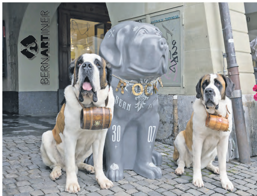
BernARTinter verzaubern Bern.